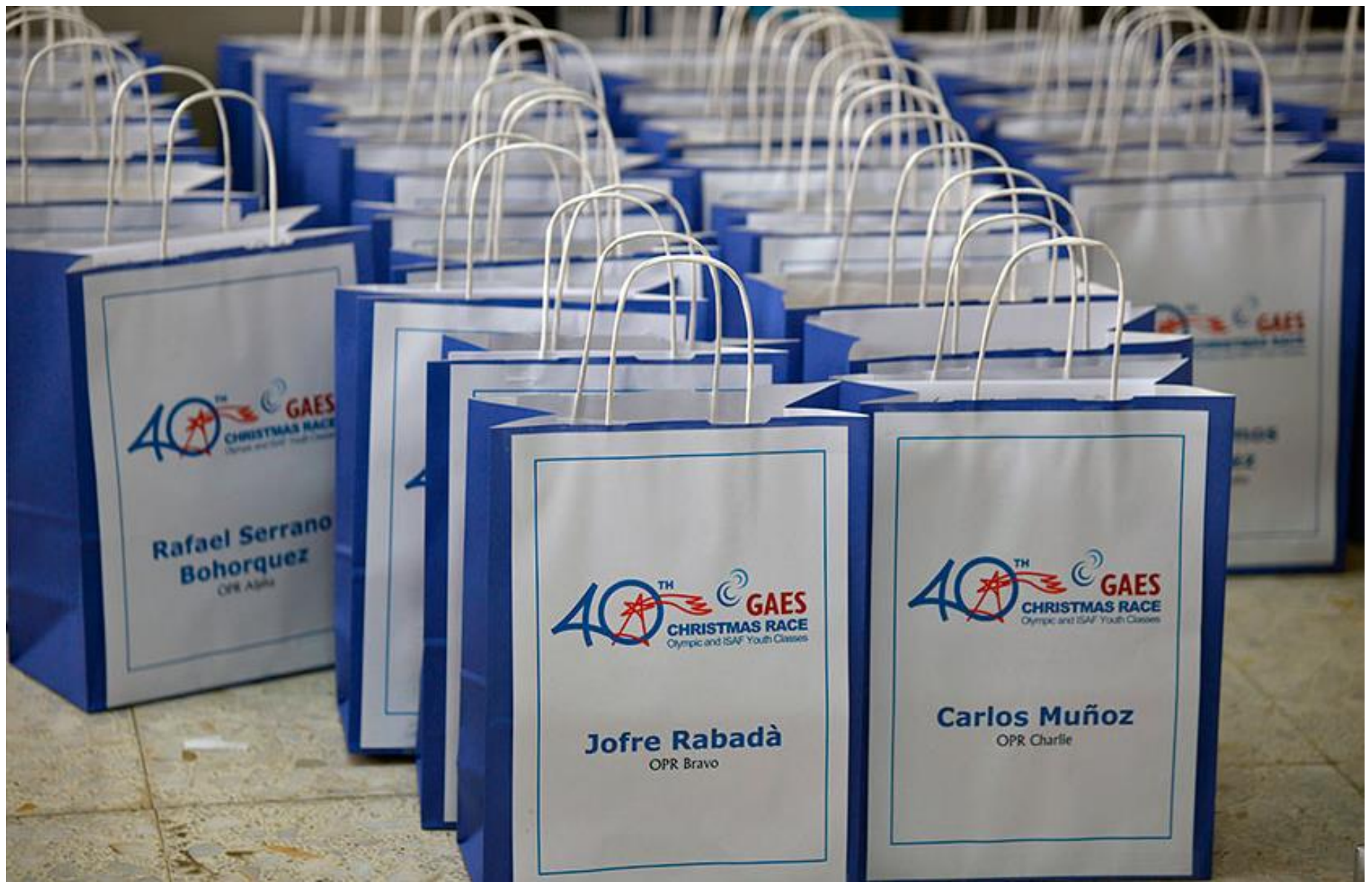
Bosses d'obsequis per els participants