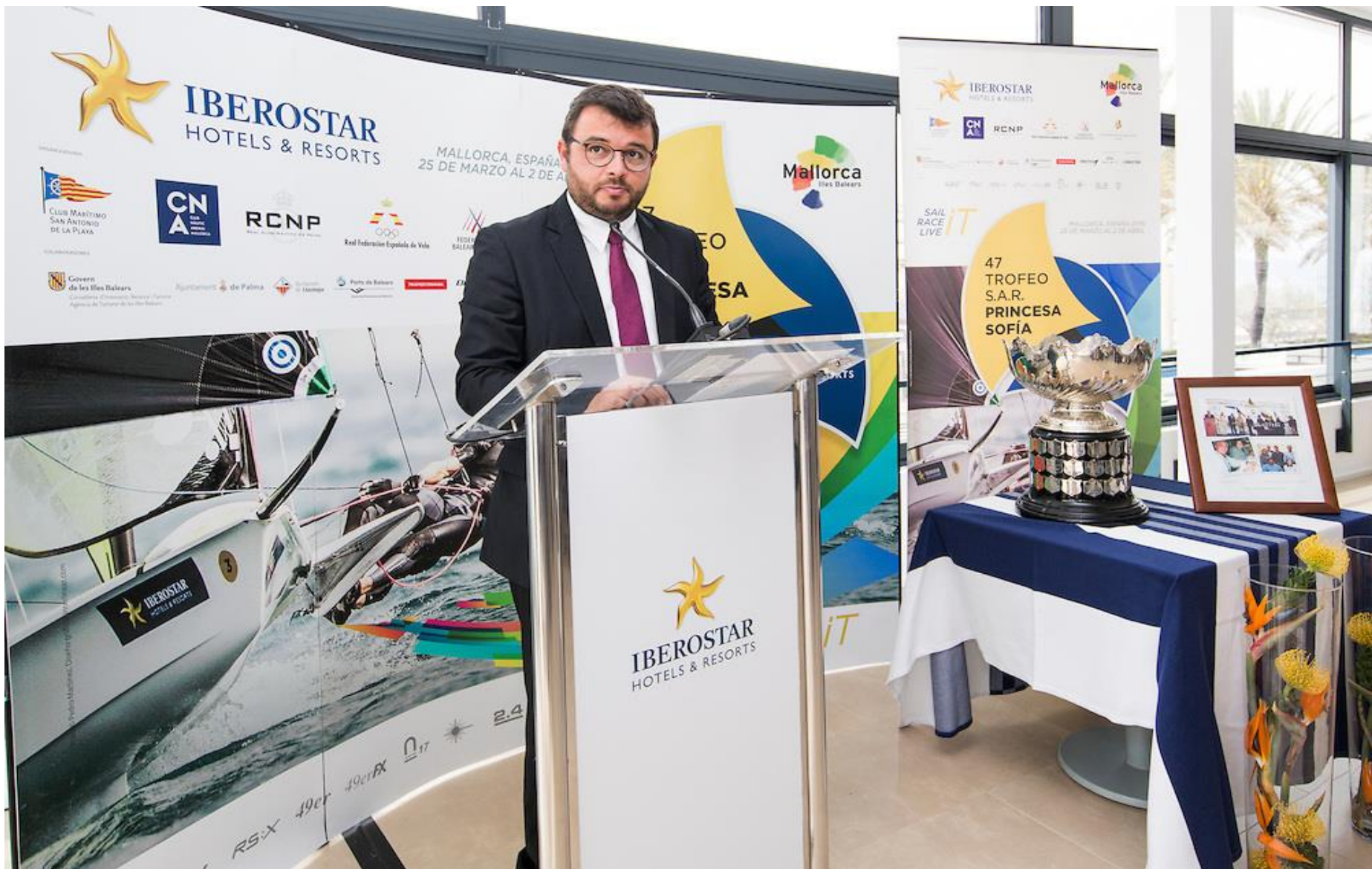
Lliurament de premis