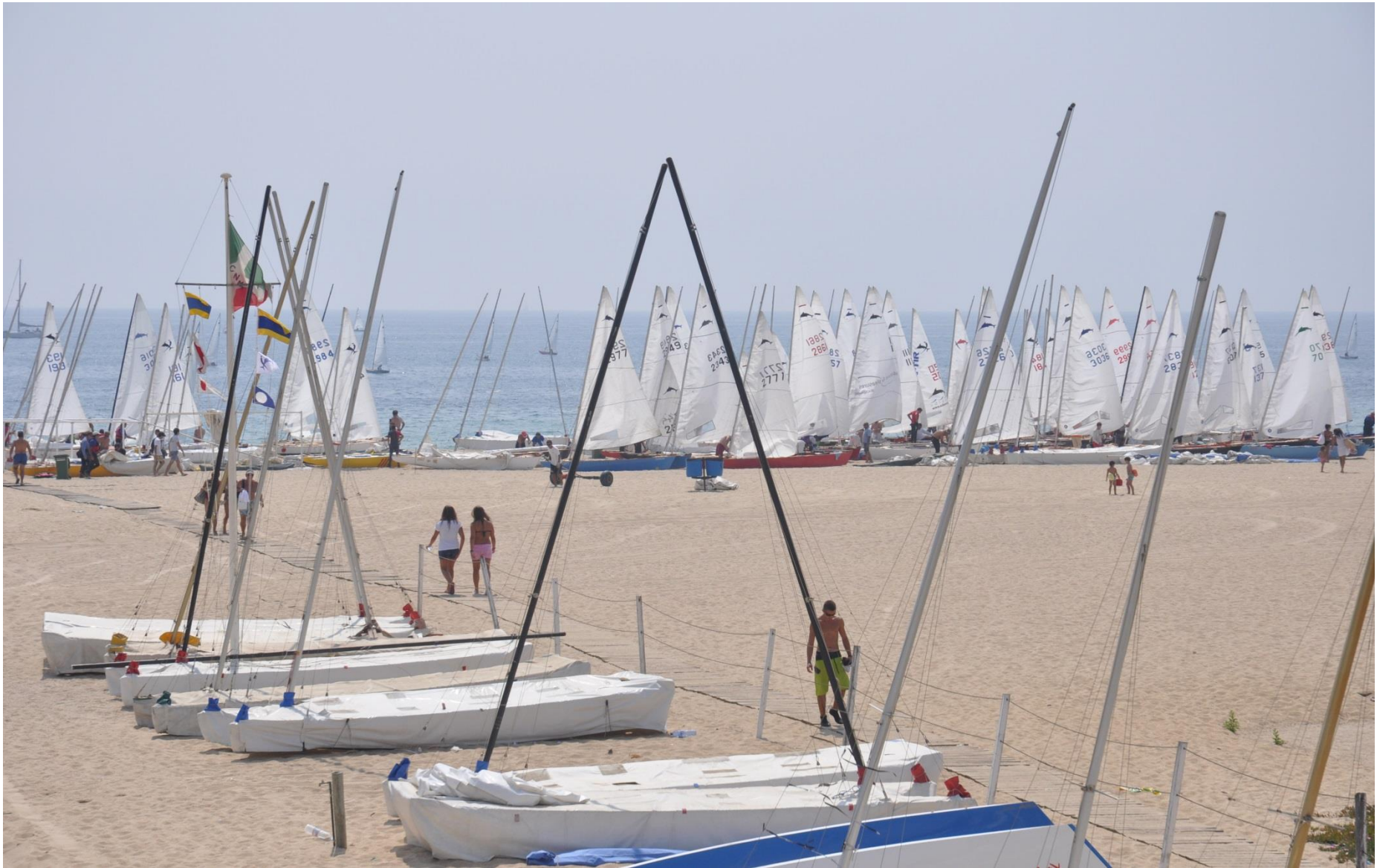
PLATJA DEL CN EL MASNOU PER LES EMBARCACIONS DE PATÍ A VELA I CATAMARANS