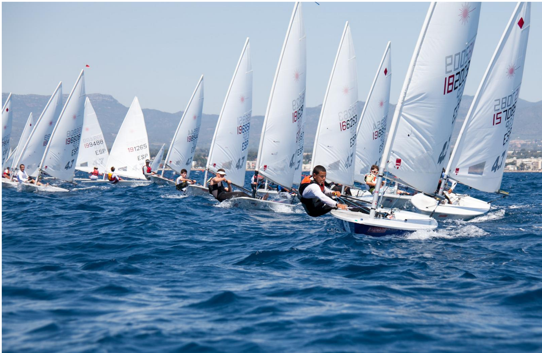
EMBARCACIONES INDIVIDUALES LASER – EUROPEES – STEL - FINN