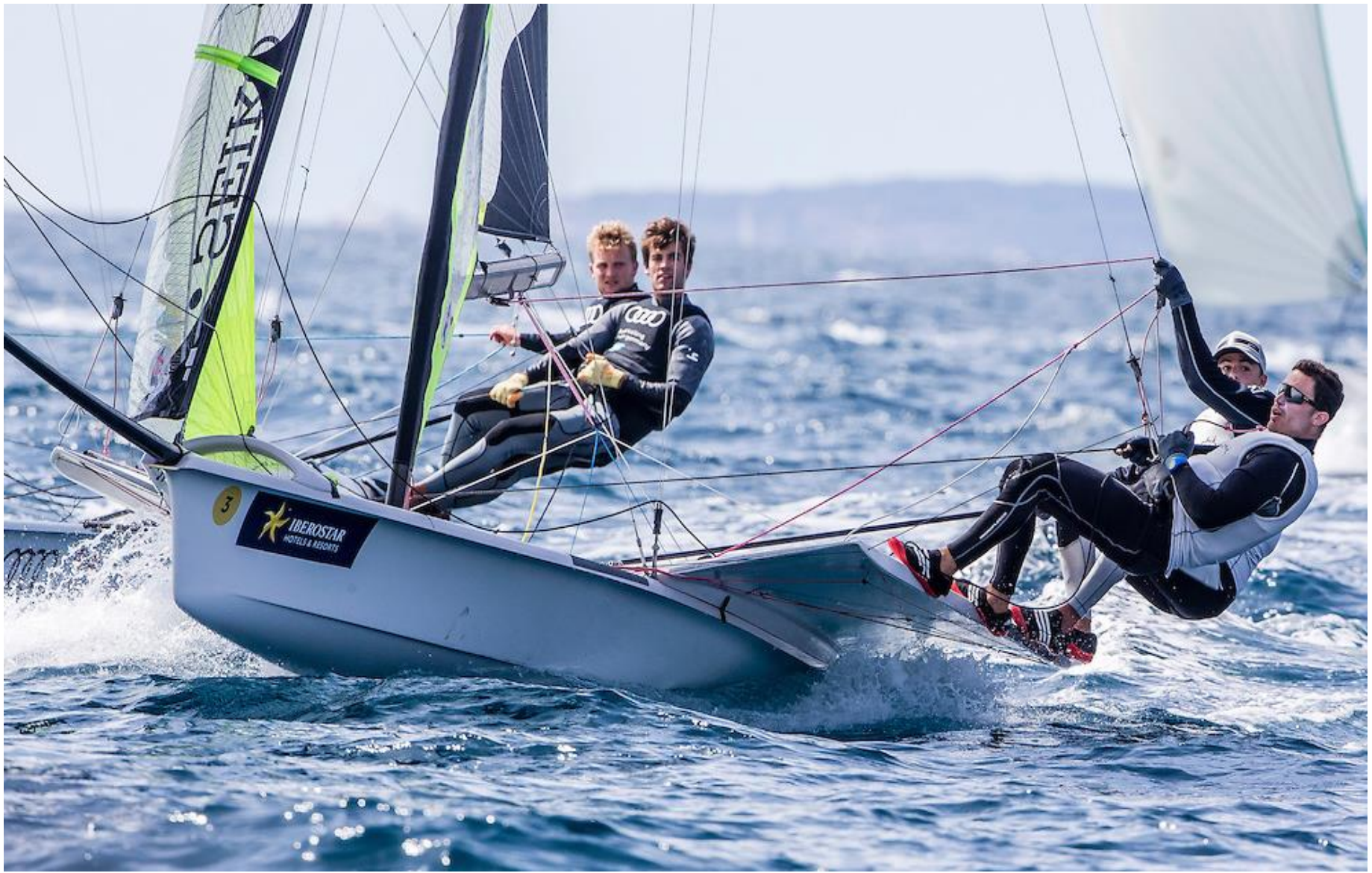
Proes de les embarcacions