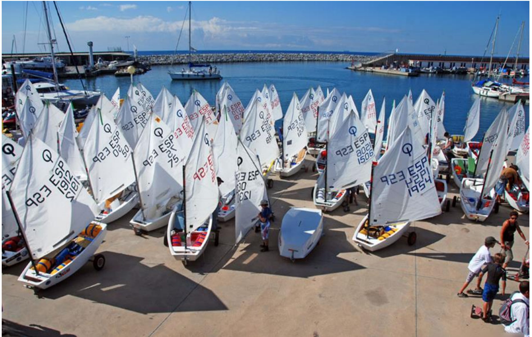
BASE NÀUTICA PER A VELA LLEUGERA