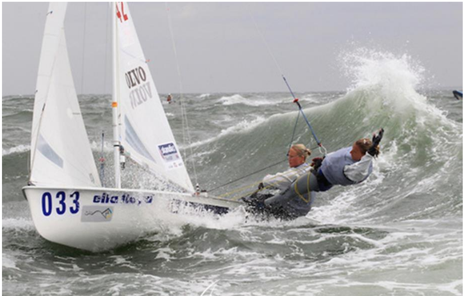
EMBARCACIONS DOBLES 420 – 29ER – 470 - OPEN