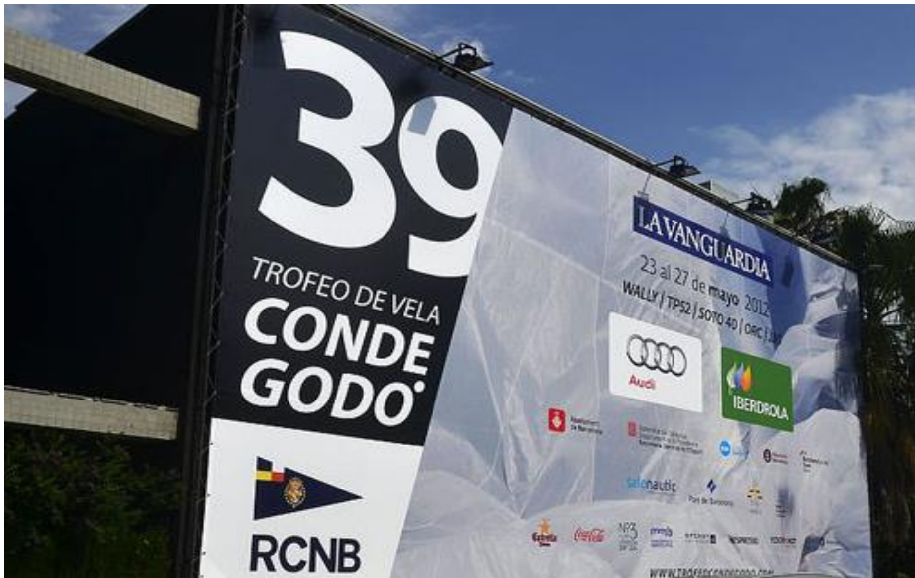
A les pancartes i banderes